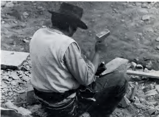
De maatschappijgrondslag wordt gevormd door de economische structuur in die maatschappij.